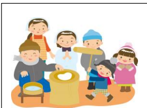
60年ほど前、餅つきの日には早朝から家族総出の準備に、子供も大はしゃぎ。