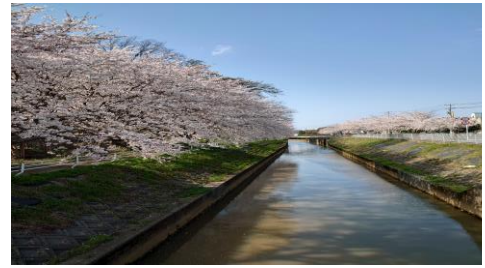
仏徳寺 用水沿いの桜並木

人民大会堂で習近平にひざまづくように挨拶するテドロス WHO 事務局長