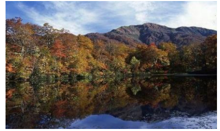
福井一の紅葉 刈込池

それに引き換え昔から引き継がれているのが11月15日頃行う「七五三」です。この行事が始まった平安時代には、子供の死亡率が高くて7歳まで成長させるのは大変だったのです。そこで節目の「髪を伸ばし始める3歳の男女児」「袴をはくようになる5歳の男児」「大人の帯を締める7歳の女児」を祝うようになったという事です。何時の時代も子供の成長を願う親の気持ちはまだまだ変わらないようです。