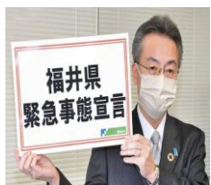
県独自の「緊急事態宣言」を出す杉本知事=2020年4月14日、県庁で

A: 感染者が多い地域ではコロナ専用病院、専用介護施設を作るしかないのかな？現実的には難しそうだし、とにかく「感染しない。感染させない。」