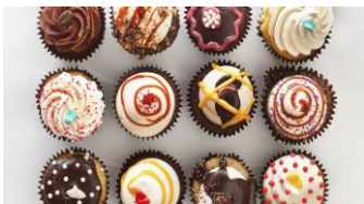
義理チョコやホワイトデーも日本だけ。