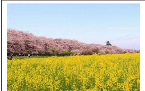
埼玉県幸手市 幸手権現堂桜堤 桜の名所 全国1位 桜のピンクとなばなの黄色が・・・

3月末から新規新型コロナウイルス感染者の勢いの衰えてきたようですが、今年の5波の終わりのように急速な収束には至っていないようです。オミクロン株の特性なのでしょう。それとも国民の中に蔓延した「コロナ慣れ」で、感染症予防対策が緩んでいるのでしょうか？人の移動の多いこの時期は特に気を付けたいものです。