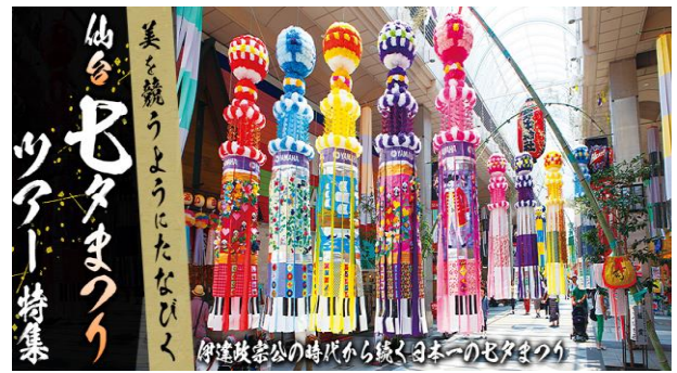
仙台七夕まつり

7月2日は「半夏生」 。夏至から11日ほど経った日で、ここから 7日の七夕 までの期間を言います。福井では大野を中心に定番の「焼きサバ」を食べる風習がありますが、各地では違う風習もあるようです。七夕は古代中国の天の川伝説に由来しますが、織姫は機織りが上手だったことから、手芸や裁縫の上達を願う宮中行事となり、現代では習い事などの上達を願ったり、ほかの願い事も短冊に託すようになりました。ちなみに旧暦の7月7日は現在の8月上旬で、有名な仙台の七夕祭りは8月6～8日だそうです。コロナ禍も一服して、同時期に催される青森の「ねぶた祭」、秋田の「竿灯まつり」など東北のお祭りを巡るツアーも人気ようです。 18日(第3月曜日)は「海の日」 で夏休み前の連休で海や山への人出が増えそうですが、くれぐれも事故の無いように体調管理に注意し、自然災害への準備も怠らないよう気を付けましょう。