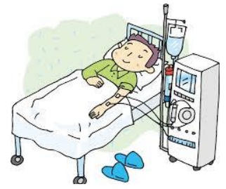
血液透析のイメージ

2~3日の旅行であれば透析日の調整で可能です。それ以上となると滞在先での透析場所の確保が必要になるなど、生活に制約を受けることになります