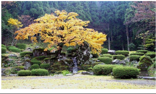
一乗谷朝倉氏遺跡 諏訪館庭園の紅葉

11月15日は「七五三」 です。数え年で、男の子は5歳、女の子は3歳と7歳に、晴れ着を着て神社・氏神に参拝して、その年まで無事成長したことを感謝し、これから将来の幸福と長寿をお祈りする行事ですが、最近では15日にこだわらずお参りするようです。 11月23日は「勤労感謝の日」 で勤労を尊び、生産を祝い、国民が互いに感謝し合う日として、1948年に制定されました。1945年までは宮中および各地の神社で行う新嘗祭(にいなめさい)の日でしたが、敗戦後、アメリカの感謝祭(サンクス・ギビング・デー)にならって「勤労感謝の日」に改めたのでしょうか。