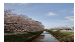
近場の名所 仏徳寺の用水際

A: あっ、それ原因はね、冬の間、九州では気温が十分下がらなくて「休眠打破」という花芽が出るスイッチが入らなかったからだって。