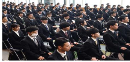
関西電力の入社式では、マスク着用は「個人の判断」に任された(産経新聞より)

こんにちは。4月は入学式や入社式など、新生活がスタートする節目の月です。そして4月1日からは暮らしの中の制度がいろいろ変わります。例えば労働基準法の改正により、働き方改革の一環で月60時間超の時間外労働の割増賃金率が50%に引き上げられます。また賃金が労働者の同意を得た上で、一定の要件を満たした場合に限って、デジタルマネー(PayPayなどスマートフォンの決済アプリや電子マネー)による支払いが解禁されます。健康保険法改正では出産育児一時金が働き方を問わずだれでも42万から50万に増額され、育児・介護休業法改正では大企業での育児休業の取得状況