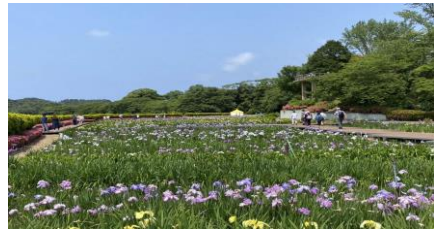
北潟湖畔 花菖蒲園 2022 6.10

こんにちは。昔は田植が終わって田んぼに水を張る必要のある月「水張り月（みずはりづき）」といわれた6月になりました。 6月1日は昔から衣替え と云われ、学校では制服が夏用に代わりましたが、平成17（2005）年度から政府が地球温暖化対策の一環として過度な冷房に頼らず様々な工夫をして夏を快適に過ごすライフスタイルいわゆる「クールビズ」を提唱してからは影が薄くなりましたね。 10日～18日は北潟湖畔で花菖蒲まつり が開催されます。右写真は昨年の様子ですが、今年も6月初旬には開花が始まるだろうと予想されています