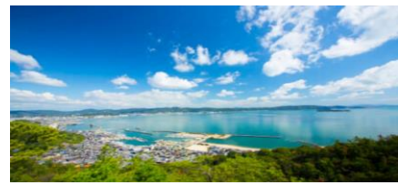
海の日を祝日にしているのは日本だけ

ますね。その頃には蝉時雨が聞こえ、梅雨も明けるのではないのでしょうか。それは30日の「土用丑の日」。古来からこの日は「う」の付くつくものを食べて無病息災を願っていたところ江戸時代に土用の丑の日＝うなぎブームが広がったという逸話も残っており、このブームは今も続いているわけです。夏バテ防止にウナギは結構ですが、毎日食べられませんね。皆さんはバランスの取れた食事をしっかり食べて、夜更かしをせず、規則正しい生活で夏を乗り切りましょう。ご自愛ください 院長