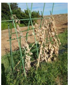
白骨化したキュウリ ちょっと不気味

梅雨明け以降、なかなか菜園に近づけません。猛暑と生い茂る雑草のため、トマトやナスの収穫もままなりません。