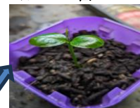
種から育てたミカンの苗

3月は天候不順があり(特に休日に)なかなか菜園の準備ができませんでした。そんな中、ようやくジャガイモを植え付ける用意ができ、10日ごろには植えられるでしょうか。ついに芽が出た