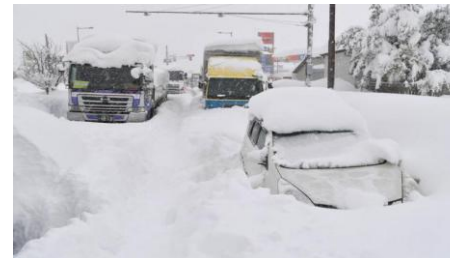
平成30年(2018) . 2.7 坂井市付近

こんにちは。2月になりました。1月中はほとんど雪もなく今年は暖冬かと思われていましたが、立春寒波が来るようです。今から7年前(2018)2月4日ごろに降り始めた雪は8日ごろまで続き、記録的な大雪で国道8号線に閉じ込められた車の列は全国ニュースにもなりましたね。今年は地球が太陽を1周する時間が365日ぴったりでないため、2日が節分、3日が立春となります。いずれにしても冬から『新春』に切り替わる節目の時期なのですが、北陸ではこれまでもたびたびこの時期に大雪になっています