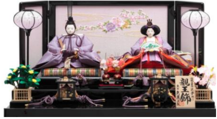
匠夢作 木製二段 親王飾り ¥380,000 (税込) 人形の久月より

こんにちは。弥生(やよい)3月は、草木がますます生い茂る季節ですが、日中は日差しが暖かく感じられるものの、朝晩の気温は低いことが多く、昼夜の気温差が大きくなるのも特徴です。3月の行事といえばまず ひな祭り(3日) 。雛人形はお雛様に女の子の穢れを移して厄災を身代わりに引き受けてもらうためと云われています。月の前半には卒業式で涙を流す人が居るかと思えば、「春闘で賃上げを」と意気込む方もいるのかな。14日は「 ホワイトデー 」いつの間にか定着しましたね。17日から23日までは お彼岸(中日の春分の日)