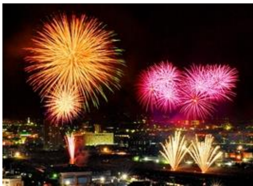
福井フェニックス花火大会 2018

8月の行事といえばお盆です。ご存じのように通称「お盆」は8月13日から16日までの4日間、先祖の霊を迎え供養する仏教行事の「盂蘭盆」のことですが、近年では「故郷を離れた兄妹や子供、孫が夏休みを利用して帰省し、ついでに墓参りをする時期」という感じですかね。今年は「山の日」の祝日も入れると8月10日から18日まで9連休という人も珍しくありません。5月にも9連休があり、そんなに休んでどうするのというのは私の考えが古いのでしょうか。とにかく連休中は暑さ真っ盛りの上、色々な疲労も重なります。くれぐれも熱中症に気を付けて、ご自愛ください。